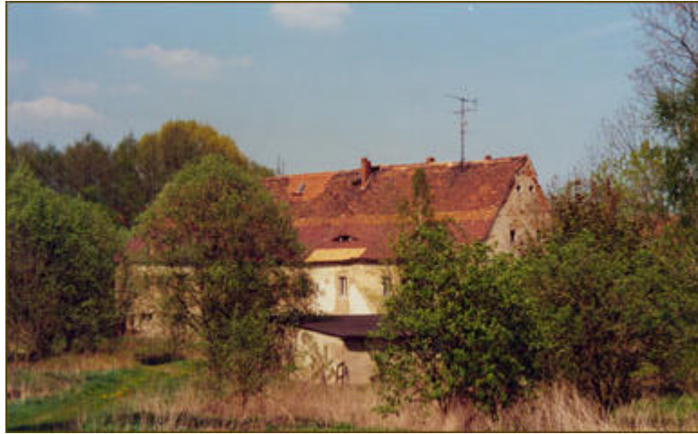
Rittergut Reichenau, Hauptwirtschaftsgebäude, ohne Dachreiter